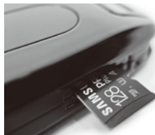
SDカードをセットして下さい。

「電源」ボタンを長押し（1秒以上）して、青色と赤色インジケータが点灯してオフになります。