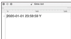
※お使いのパソコン、ソフトにより表示が違います。